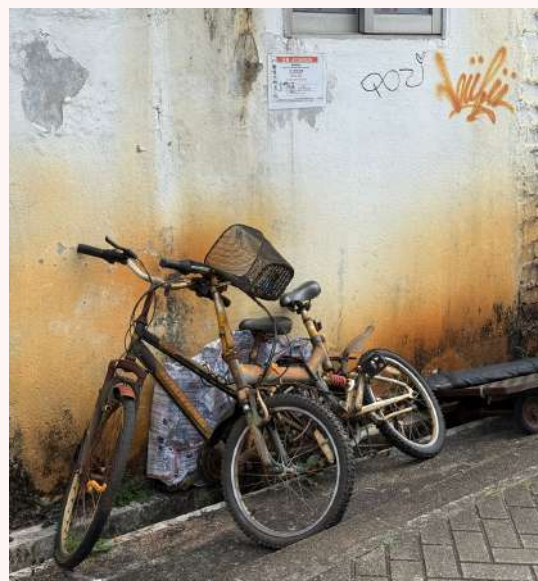
視藝科攝影作品：西貢小巷 (5B 李琰祺)