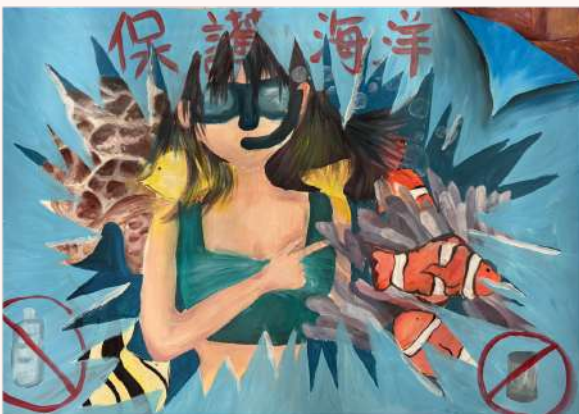
視藝科作品：「保護海洋生態」海報 (6C 張善淇)

There are still lots to be discovered in the district apart from fishing boats in sandy beaches. I highly encourage all of you to visit Sai Kung district once in a lifetime. Not only can you savour the mouth-watering seafood or Tseung Kwan O's modern vibe, but also know each single story told by every corner.