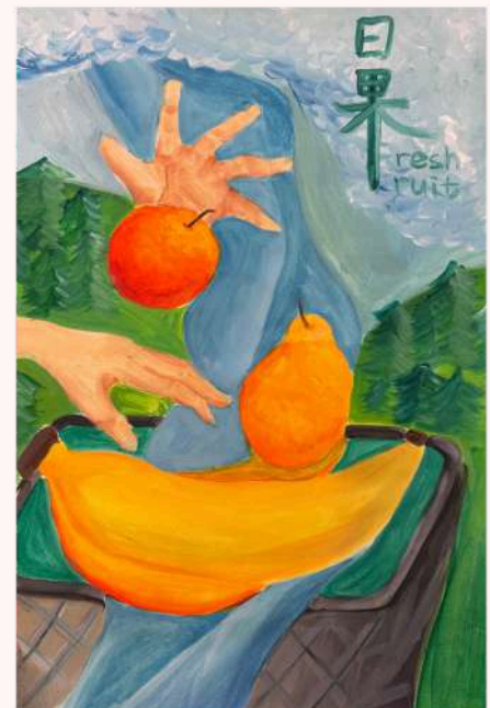
視藝科作品 健康雜誌封面 (5B 嚴子秦)