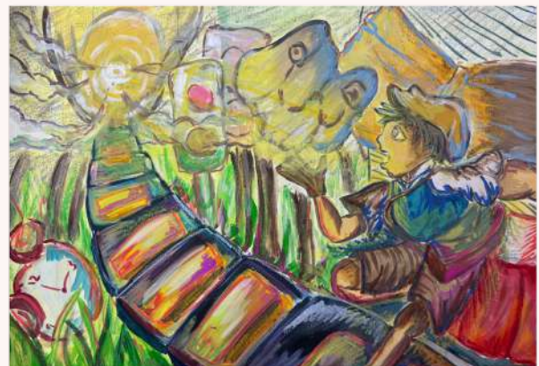
視藝科繪畫作品：回到過去 (5A 麥欣彤)